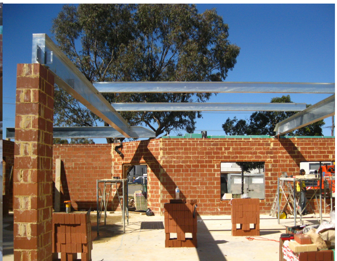
Old Sangawasa building